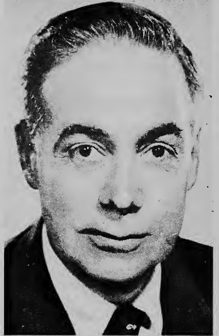
Gov. William W. Scranton

Ta tambe pa rason aki cu mi a llega ne conclusion cu tur cu ta comparti di ideanan, ta haci bon di tuma parti pe candidatura di gobernador Scranton. "Mi mes lo apoya Scranton completamente, y mi lo coopera cu ne pa realisa pa loke mi ta lucha". segun e gobernador - Rockefeller.